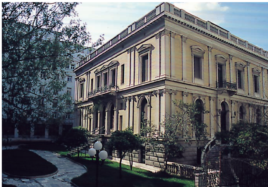
Το ιστορικό κτήριο της οδού Πανεπιστημίου, από τα αξιολογότερα έργα του Γερμανού αρχιτέκτονα Ερνέστου Σσίλερ. Κτίστηκε το διάστημα 1878-1879 ως κατοικία της οικογένειας Σλήμαν. Εδώ, η πίσω όψη του κτηρίου

Επιστημονικές διαλέξεις και ημερίδες, ενίοτε πλαισιωμένες από θεατρικά δρώμενα, εσπερίδες και μουσικές βραδιές εντός του κτηρίου, αλλά και στον μαγευτικό κήπο του Μουσείου, τον Κήπο των Μουσών. Συναυλίες, θεατρικές παραστάσεις, βραδιές χορού και παρουσιάσεις βιβλίων, βραδιές τζαζ και προβολές ταινιών, πάντα σε άριστη συνεργασία με το Café, έχουν κατα-