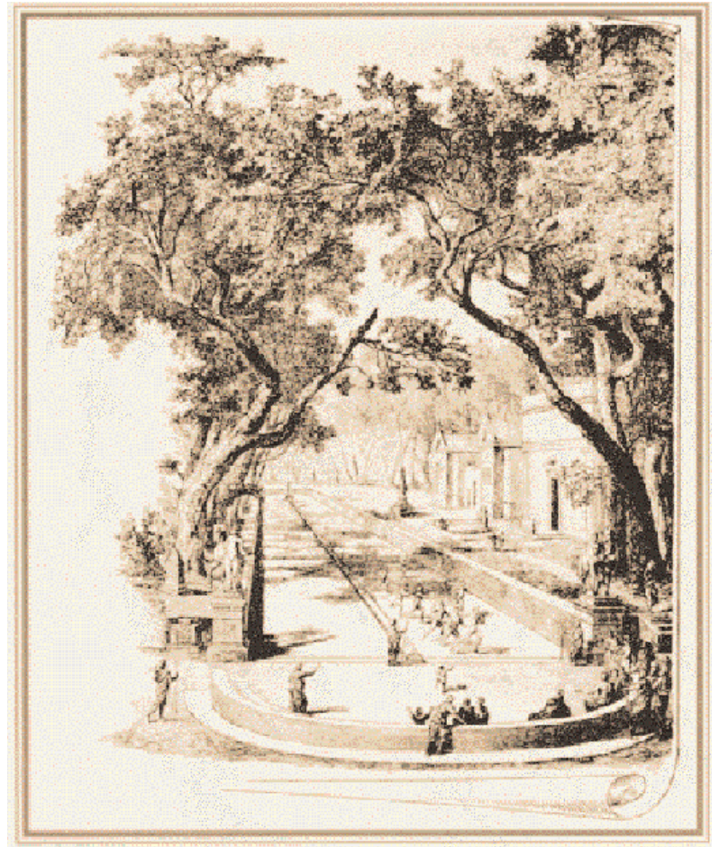
Ειδυλλιακή αναπαράσταση της Ολυμπίας του τέλους του 19ου αιώνα

Εκείνη την εποχή, η φυσική κοιλότητα του Αρδηττού, στην αριστερή όχθη του Ιλισού, στη θέση Άγρα του δήμου της Αγρυλής, ανήκε στον Αθηναίο Δεινία 10 . Σύμφωνα με τον Ψευδοπλούταρχο ( Βίοι δέκα ρητόρων , Λυκούργος), ο Λυκούργος «και τω σταδίω τω παναθηναϊκῶ την κρηπίδα περιέθηκεν, εξεργασάμενος τούτό τε και την χαράνδραν ομαλήν ποιήσας. Δεινίου τινός ος εκέκτητο τούτο το χωρίον ανέντος τη πόλει, προσειπόντες αὐτῷ χαρίσασθαι Λυκούργω» 11 . Ανήκοντας στην πολιτική μερίδα του Λυκούργου 12 , ο Δεινίας ήταν ο πρώτος που πείστηκε να παραχωρήσει την ιδιοκτησία του για τη διαμόρφωση του σταδίου των Αθηνών και ο δήμος επέλεξε επιμελητές, τους «επί το στάδιον ηρημένους» 13 , στους οποίους ανετέθη η σχετική μέριμνα 14 . Από την ίδια φάση της ιστορίας του σταδίου