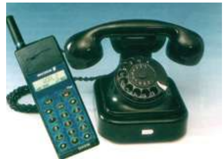
Μέσα σε μερικές δεκαετίες, οι τηλεφωνο μεταμορφώθηκαν από σχετικά ακριβή και σπάνια “επιτέλους” σε πανταχού, τεχνολογικά, εύκολα προσιτά ανέγχα

«Η κινητή τηλεφωνία έχει μπει για τα καλά στη ζωή μας. Οι συνδρομητές της Ραπαφον και της Telestet έχουν ξεπεράσει ήδη το μισό εκατομμύριο, ενώ περισσότεροι από ένας στους είκοσι Έλληνες διαθέτουν “κινητό”. Ο κλάδος κάθε άλλο παρά στάσιμος είναι, αφού οι επενδύσεις αυξάνονται και νέες υπηρεσίες προστίθενται στις ήδη υπάρχουσες. Παράλληλα, μετά από καθυστέρηση, ο ΟΤΕ πραγματοποιεί μια παλιά του επιθυμία μπαίνοντας δυναμικά στο παιχνίδι – και δημιουργώντας έτσι νέα δεδομένα. Ακόμα δεν είναι γνωστό ποιες θα είναι οι άμεσες εξελίξεις στον “χορό” των δισεκατομμυρίων. Γεγονός είναι πάντως ότι με την αυγή του νέου αιώνα, το 8% του ελληνικού πληθυσμού θα διαθέτει κινητό τηλέφωνο».