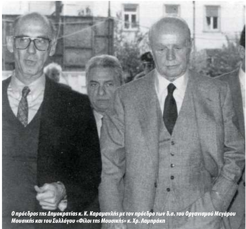
Ο πρόεδρος της Δημοκρατίας κ. Κ. Καραμανλής με τον πρόεδρο των δ.σ. του Οργανισμού Μεγάρου Μουσικής και του Συλλόγου «Φίλοι της Μουσικής» κ. Χρ. Λαμπράκη

να κατασκευάζεται το 1976 από τον σύλλογο «Οι Φίλοι της Μουσικής». Αλλά η ιστορία του υπήρξε μακρά και πολυκύμαντη – όπως καταγράφεται στο περιοδικό. (Τεύχος 650, Μάρτιος 1991): «Τον μήνα αυτό, αρχίζει στην Αθήνα τη δοκιμαστική λειτουργία του ένας χώρος που υπήρξε το όραμα ζωής μερικών εμπνευσμένων Ελλήνων εδώ και αρκετές δεκαετίες και που φιλοδοξεί να θέσει τη σφραγίδα στον πολιτιστικό χάρτη της χώρας μας πρώτα, αλλά και της Ευρώπης όλης: το Μέγαρο Μουσικής Αθηνών [...].