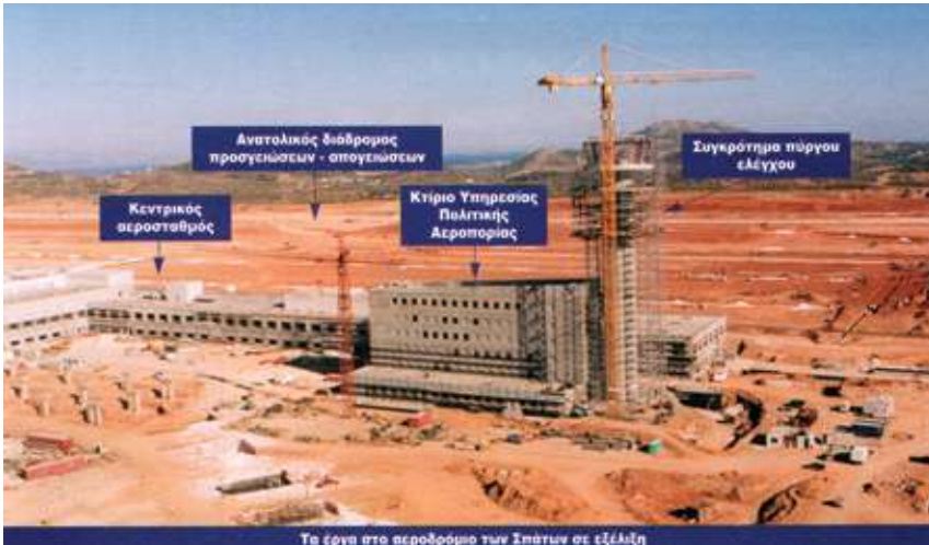
Τα έργα στο αεροδρόμιο των Σπάρτων σε εξέλιξη

παρουσιάστηκε μελέτη στην ελληνική κυβέρνηση που υποδείκνυε ως ιδανική θέση για ένα νέο αεροδρόμιο τα Σπάτα. Στα τέλη της δεκαετίας του 1970 οι μελέτες ολοκληρώθηκαν, αλλά το Δεκέμβριο του 1981 ακυρώθηκε το εγχείρημα. Στις αρχές της δεκαετίας του 1990, ήταν πλέον προφανές ότι το Ελληνικό δεν θα μπορούσε να εξυπηρετήσει τις αυξανόμενες επιβατικές ανάγκες, αφού δεν υπήρχε χώρος για επέκταση.