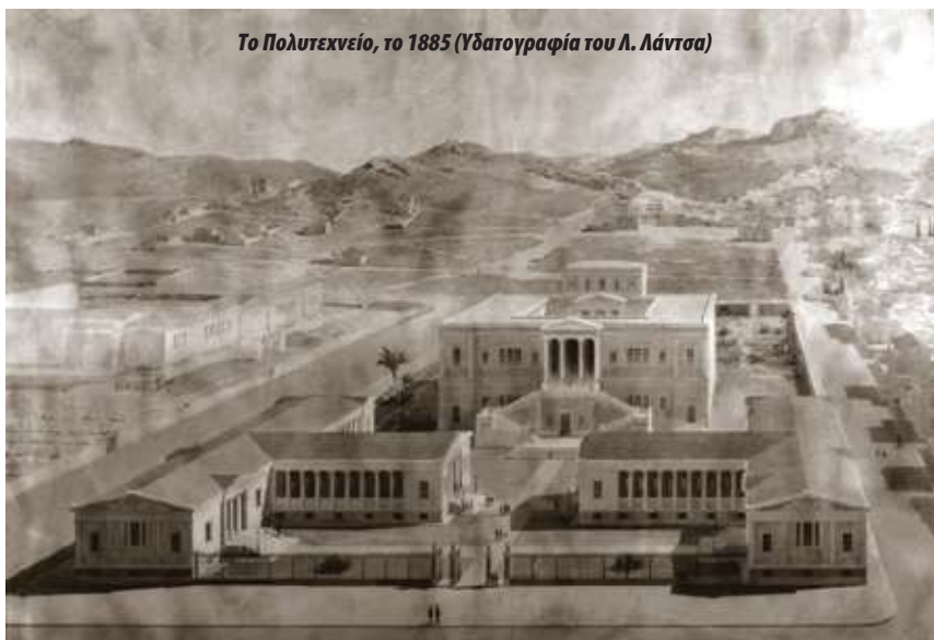
Το Πολυτεχνείο, το 1885 (Υδατογραφία του Λ. Λάντσα)

Δεν ιδρύθηκε το Πολυτεχνείο κατά το συνήθη τρόπο που ιδρύονται τα Πανεπιστήμια. Ξεκίνησε από ένα κυριακάτικο Σχολείο για στοιχειώδη μόρφωση τεχνιτών οικοδόμων και, πορευόμενο διά μέσου απιθάνων δυσχερειών και μετασηματισμών, κατέληξε σ’ ένα ανώτατο πνευματικό ίδρυμα τεχνικών επιστημών, που ελάμπρυνε την πνευματική ιστορία του τόπου και βοήθησε αφάνταστα την εξέλιξή του».