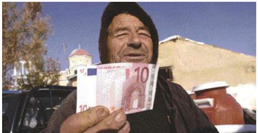
Τις πρώτες ημέρες μετά την Πρωτοχρονιά μπορούσες να αναγνωρίζεις στους περισσότερους μια... παιδική αγάπη για το νέο νόμισμα

Σε κάποιες περιπτώσεις, μάλιστα, η λατρεία του κοινού για το “νεογέννητο” ήταν εκείνη που δημιουργούσε τα προβλήματα, καθώς χιλιάδες πολιτών έσπευσαν στις τράπεζες να πιάσουν το ευρώ στα χέρια τους, υπομένοντας τις ατελείωτες ουρές (που ουσιαστικά οι ίδιοι προκαλούσαν) και κωφεύοντας στις εκκλήσεις των αρμοδίων για αυτοσυγκράτηση και παραχώρηση προτεραιότητας σε όσους χρειαζόνταν άμεσα το νέο νόμισμα». Είναι η αρχή μιας νέας